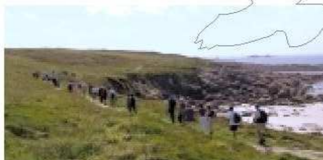
L'embouchure de l'aber lldut qui mène au port de Pors-Scaff.